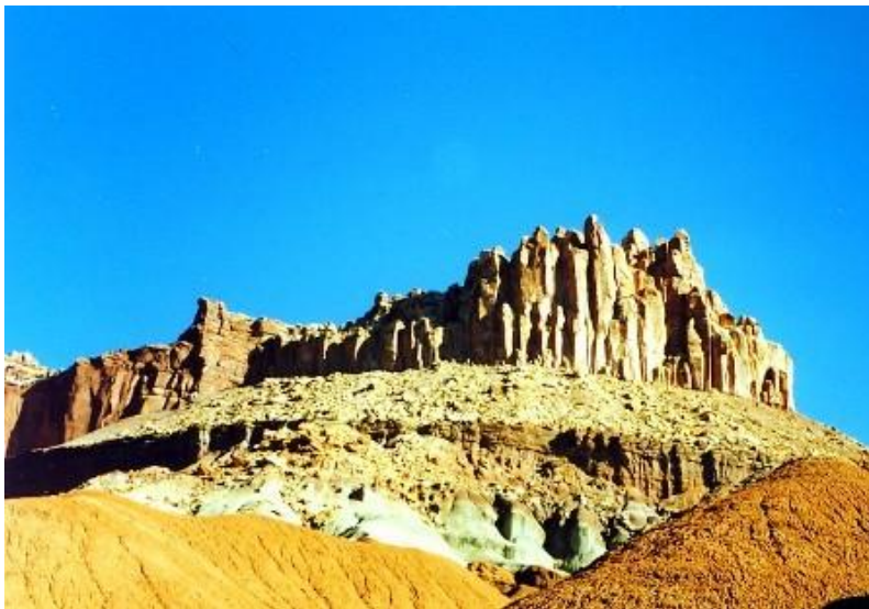
Die beiden Wahrzeichen des Capitol Reef NP: The Castle (oben)

Der wenig besuchte Capitol Reef National Park, in dem besonders schöne Wanderungen unternommen werden können, präsentiert sich mit abwechslungsreichen geologischen Formationen. Nicht nur hohe, bizarr geformte rote Felswände, sondern auch große abgerundete Steinklippen aus hellem Sandstein prägen die Landschaft.