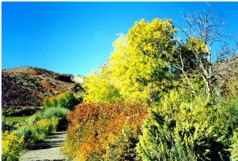
Herbststimmung auf dem Freemont River Trail

Außerdem besichtigten wir die kulturgeschichtlich interessanten Sehenswürdigkeiten am Hwy-24 (Fruita Historic District mit Fruita School, Petroglyphs und Behunin Cabin).